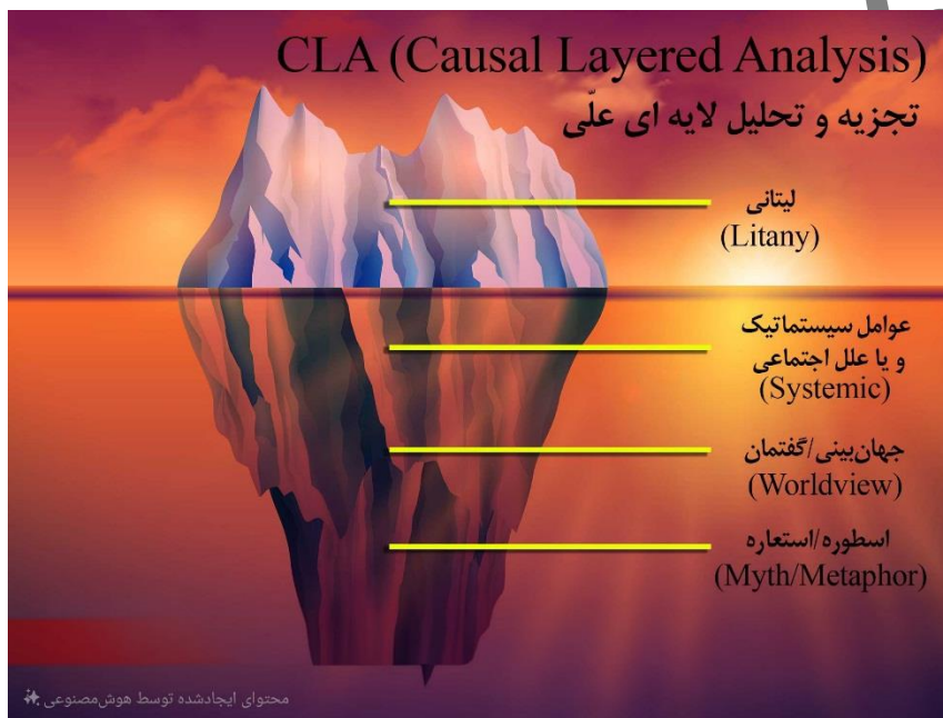
شکل شماره یک: موضوعات به مثابه کوه یخی

تحلیل لایه‌لایه علی (CLA): این روش که توسط سهیل عنایت‌الله ابداع شده، شامل چهار سطح «لیتانی»، «علل سیستمی»، «جهان‌بینی» و «استعاره و اسطوره» است (عنایت‌الله، ۱۳۸۳، ص ۴۵). در این مدل، موضوعات پژوهش به مثابه کوه یخی هستند که تنها بخش کوچکی از آن (سطح لیتانی) در نگاه نخست قابل مشاهده است (Hoffman, 2012, p.3). در شکل شماره یک، توضیحات تکمیلی آورده شده است.