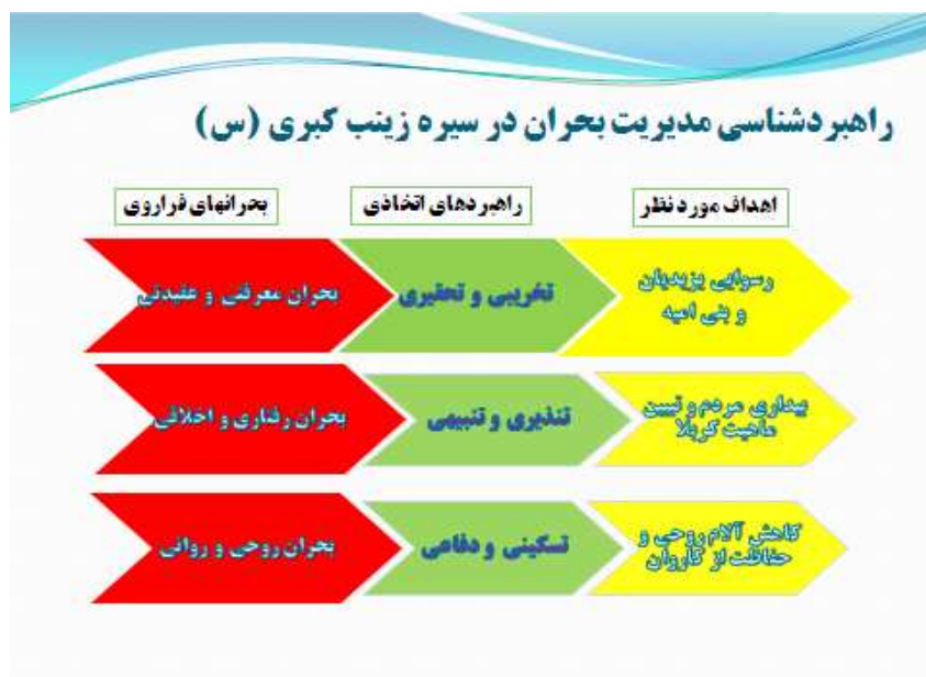
نمودار ۲. راهبردشناسی مدیریت بحران در سیره حضرت زینب (س)