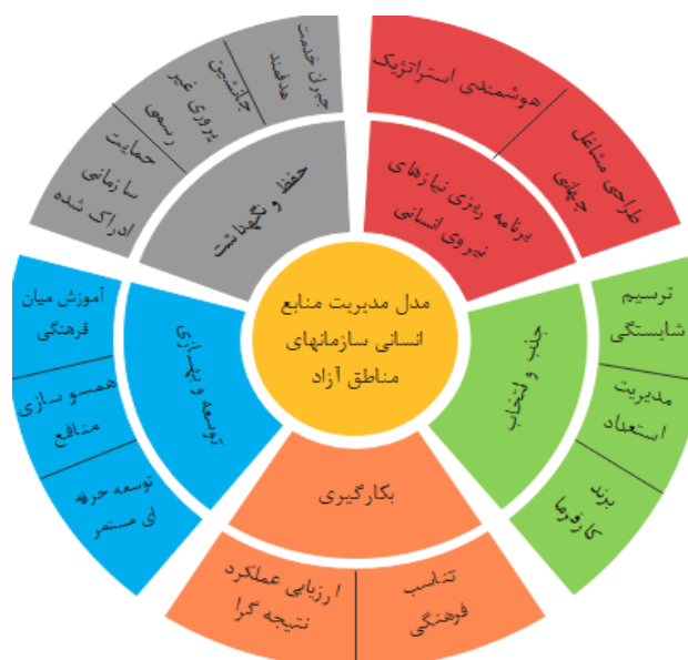
شکل ۲. چارچوب مدیریت منابع انسانی در سازمان‌های مناطق آزاد

به‌رغم دقت در همهٔ مراحل، این پژوهش نیز با محدودیت‌هایی مواجه بود که به تعدادی از آن‌ها اشاره می‌شود: کمبود پژوهش‌های مشابه و بومی، عدم دسترسی به همهٔ پایگاه‌های علمی بین‌المللی، اعتبار بیرونی اندک، دقت در تعمیم نتایج. با توجه به نتایج پژوهش پیشنهاد می‌شود در بعد برنامه‌ریزی نیازهای نیروی انسانی اقدامات اصلاحی طراحی ارگانیک ساختار و هم‌سویی استراتژیک منابع انسانی و سازمان، در بعد جذب و انتخاب اقدام اصلاحی افزایش انعطاف‌پذیری و مشروعیت اجتماعی فرصت‌های استخدامی، در بعد به‌کارگیری اقدامات اصلاحی تشویق مشارکت و کارهای گروهی (تیم‌سازی) و توسعه و غنی‌سازی شغلی و تعیین و ارزیابی الزامات عملکرد پرسنلی، در بعد توسعه و بهسازی اقدامات اصلاحی تقویت دوایر کیفیت و نهادینه‌سازی ارزش‌های سازمان و آموزش‌های ضمن خدمت و کاربردی، و در بعد حفظ و نگهداشت اقدامات اصلاحی برقراری عدالت در پرداخت‌ها و اجرای برنامه‌های جانشین‌پروری و تعیین برون‌دادهای کلیدی منابع انسانی در مدیریت منابع انسانی سازمان‌های مناطق آزاد انجام شود. سخن آخر اینکه یکی از ویژگی‌های پژوهش‌های کیفی امکان تولید نظریه‌های مختلف در خصوص یک پدیده است. در این پژوهش نیز هر آنچه حاصل شد تفسیر پژوهشگری است که علاقه‌مند به بررسی وضعیت مدیریت منابع انسانی در سازمان‌های مناطق آزاد و ارائهٔ پیشنهادهایی در خصوص بهینه کردن نحوهٔ مدیریت آن در این سازمان‌هاست. مطمئناً تفاسیر دیگر در این خصوص می‌تواند تکمیل‌کنندهٔ دانش مدیریتی این حوزه باشد.