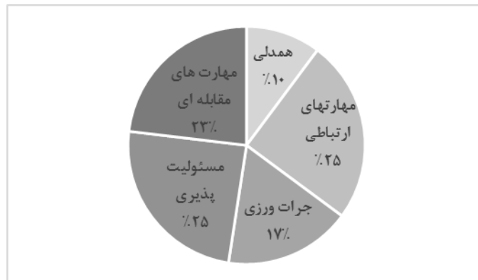
نمودار ۱. درصد فراوانی مقوله‌های مؤلفه‌های مهارت‌های اجتماعی در سند تحول بنیادین

در مرحله بعد، به منظور برآورد میزان درجه اهمیت شاخص‌ها از روش آنتروپی شانون استفاده شد. آنتروپی در تئوری اطلاعات شاخصی است برای اندازه‌گیری عدم اطمینان، که از طریق توزیع احتمال بیان می‌شود. بر اساس این روش، محتوای سند تحول بنیادین آموزش و پرورش از نقطه نظر سه پاسخ‌گو یا گزینه شامل فصول یک و دو و سه (کلیات، بیانیه ارزش‌ها، و بیانیه مأموریت)، فصول چهار و پنج (چشم‌انداز و هدف‌های کلان)، و فصول شش و هفت (راهبردهای کلان و هدف‌های عملیاتی) و پنج مؤلفه هدف طبقه‌بندی و تجزیه و تحلیل شدند.