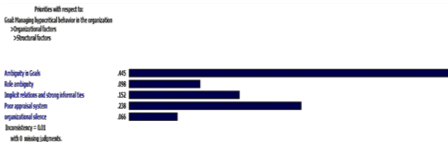
شکل ۶. مقایسه زوجی زیرشاخص‌های عامل ساختاری با توجه به هدف سلسله‌مراتب