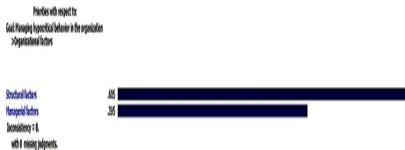
شکل ۳. مقایسهٔ زوجی عوامل مدیریتی و ساختاری با توجه به عامل سازمانی