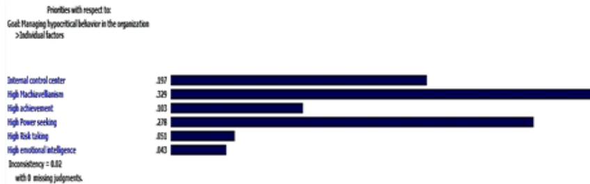
شکل ۴. مقایسه زوجی زیرشاخص‌های عامل فردی با توجه به هدف سلسله‌مراتب

با توجه به شکل ۴، خبرگان در گروه عوامل فردی مؤثر در بروز رفتارهای ریاکارانه به ترتیب ماکیاولیسم بالا، قدرت‌طلبی بالا، مرکز کنترل درونی، توفیق‌طلبی بالا، ریسک‌پذیری، و هوش عاطفی بالا را دارای بیشترین تأثیر می‌دانند. میزان ناسازگاری این مقایسه برابر با ۰/۰۲ است که در بازه قابل قبول خواهد بود.