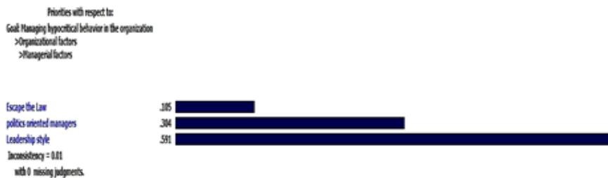
شکل ۵. مقایسه زوجی زیرشاخص‌های عامل مدیریتی با توجه به هدف سلسله‌مراتب

با توجه به شکل ۵، خبرگان در گروه عوامل مدیریتی مؤثر بر بروز رفتارهای ریاکارانه به ترتیب سبک رهبری و تصمیم‌گیری، سیاست‌پیشگی مدیران، و قانون‌گریزی را مؤثر می‌دانند. میزان ناسازگاری این مقایسه برابر با ۰/۰۱ و در بازه قابل قبول است.