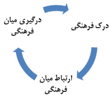
شکل ۱. ابعاد هوش فرهنگی

بر این اساس، مفهوم این مقاله از هوش فرهنگی (CI) شامل برخورد با پویایی‌های هوشی و بخش‌های غیرمنطقی به همراه برخوردهای میان‌فرهنگی و درک ابعاد و مهم‌تر از همه بُعد عملی است.