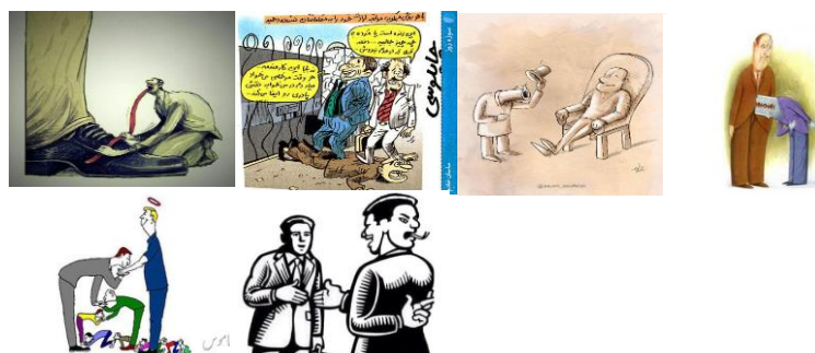
شکل ۱. تصاویر ارائه شده توسط یکی از مشارکت‌کنندگان

در ادامه، تصاویر و جدول مفاهیم و ساختارهای مستخرج از مصاحبه با یکی از مشارکت‌کنندگان پژوهش، به انضمام نقشه ذهنی وی درباره پیروی هواخواهانه در سازمان، درج شده است. همان‌گونه که از شکل ۲ برمی‌آید، فلش‌های از یک ساختار به ساختار دیگر به معنای آن است که از نظر مشارکت‌کننده بین این دو ساختار رابطه علت و معلولی برقرار است؛ مثلاً ارزش‌سنجی پیرو علت رفتارهای زهرآگین وی تلقی شده است. مشارکت‌کننده نظر خود را در ماتریس روابط علی با اختصاص عدد ۱ به سلول تلاقی این دو ساختار نشان داده است. به همین ترتیب، تصاویر و جدول مفاهیم و ساختارهای مستخرج از مصاحبه با مشارکت‌کنندگان دیگر پژوهش نیز به طور مشابه گردآوری و تحلیل شدند.