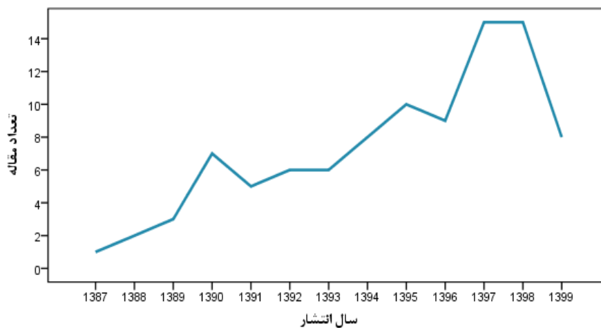
شکل ۲. روند پژوهش‌ها بر حسب سال

الف) تعداد پژوهش‌ها و روند آن: شکل ۲ روند پژوهش‌های انتشار یافته را نشان می‌دهد. همان‌گونه که ملاحظه می‌شود پژوهش در زمینه رفتارهای انحرافی سازمانی دارای روندی افزایشی است و در سال‌های ۱۳۹۷ (۱۵ پژوهش: ۱۵/۸ درصد) و ۱۳۹۸ (۱۵ پژوهش: ۱۵/۸ درصد) به اوج خود رسیده است.